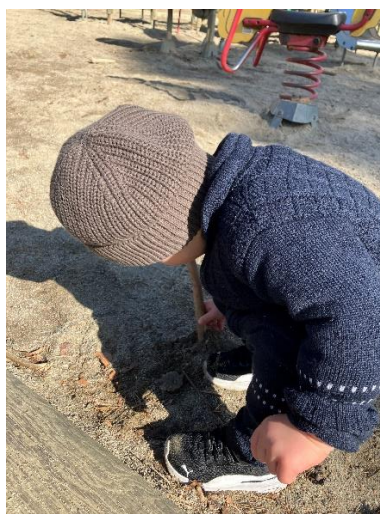
Lage mønster i sanden er gøy