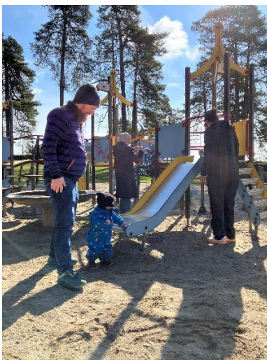
Trygt å utforske når en voksen er med

I april har vi vært ute i Kulåsparken, og barna synes det er fint å oppleve og erfare hva Kulås har å by på, og å få oppleve mestring i forhold til det. Ved å være nær og tilstede, byr det på mange spennende opplevelse og samtaler rundt det de opplever. Viktig at vi voksne er gode rollemodeller og er lekne og med i leken. Fint for foreldrene å oppleve gleden barna viser ved å være ute i naturen.