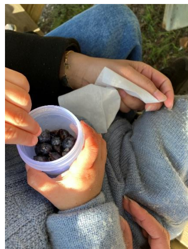
Blåbær i en kopp, fullkommen lykke