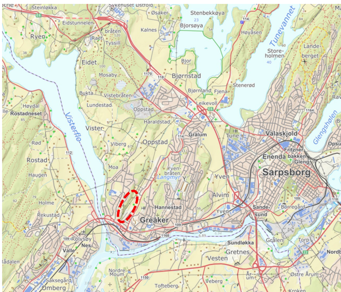
Figur 1: Oversiktskart med lokalisering av planområdet i Sarpsborg kommune.

Sweco Norge AS er engasjert for å gjennomføre risiko- og sårbarhetsanalyse (ROS-analyse) i forbindelse med detaljregulering av sykkeltiltak i Greåkerdalen i Sarpsborg kommune. Figur 1 viser et oversiktskart med lokalisering av planområdet.