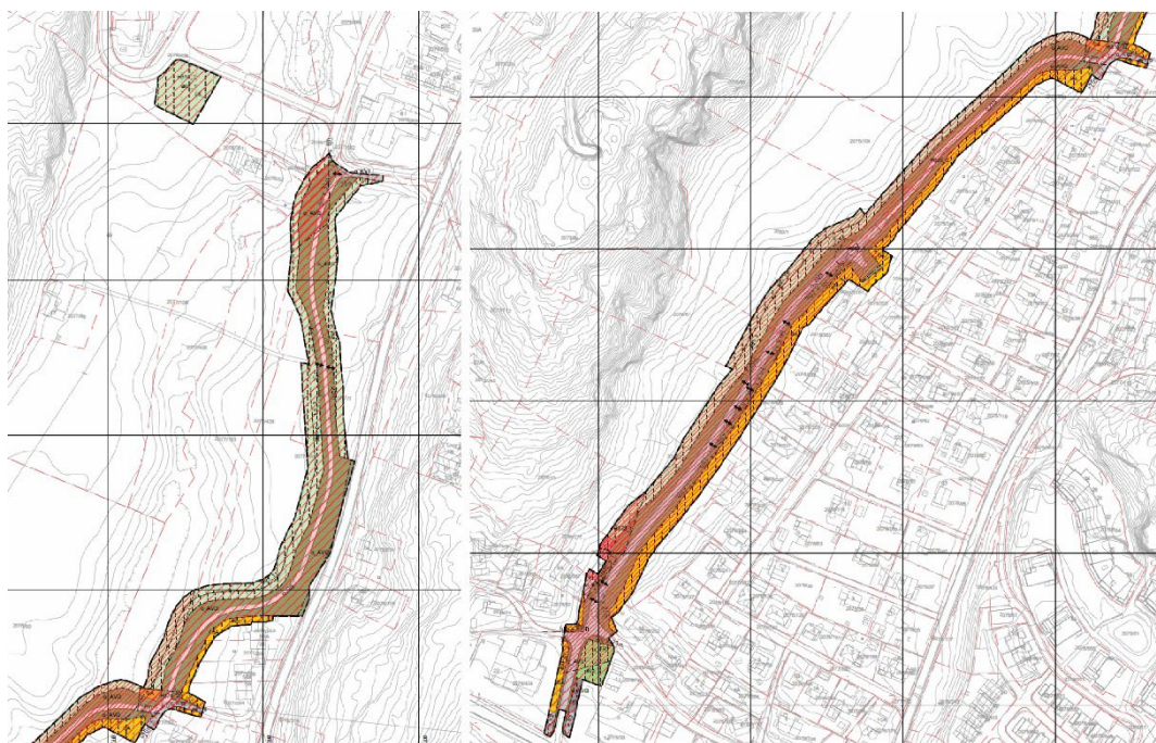
Figur 2: Plankart Fv.114 Sykkeltiltak Greåkerdalen, del 1 og del 2.

Det er behov for et sammenhengende sykkeltiltak i Greåkerdalen. I dokument vedtatt i 2017 «Hovedsykkelveier i Sarpsborg og Fredrikstad1», er strekningen langs fylkesvei 114 i Greåkerdalen en del av rute 20 Lekevoll–Greåker. Ruta er delvis mangelfull, og det er behov for flere tiltak for å få en tilfredsstillende og sammenhengende rute. Det er fysisk mulig å ta seg frem på sykkel eller som gående mellom fv. 109 i sør og fv. 1170 Gamle Kongevei i nord, men dette forutsetter lokalkunnskap, delvis sykling på smal og trafikkert fylkesvei, en lengre strekning med blandet trafikk i lokal gate, delvis tilrettelagt gang- og sykkelvei og bruk av en sti gjennom et skogsområde. Strekningen vises i «Hovedsykkelveier i Sarpsborg og Fredrikstad» som et høyt prioritert tiltak for gjennomføring, prioritert 2 av 4 mulige nivåer.