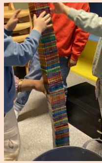
Lek- både ute og inne