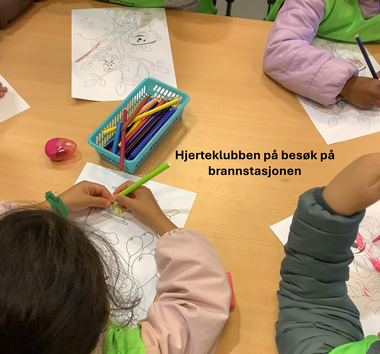
Hjerteklubben på besøk på brannstasjonen