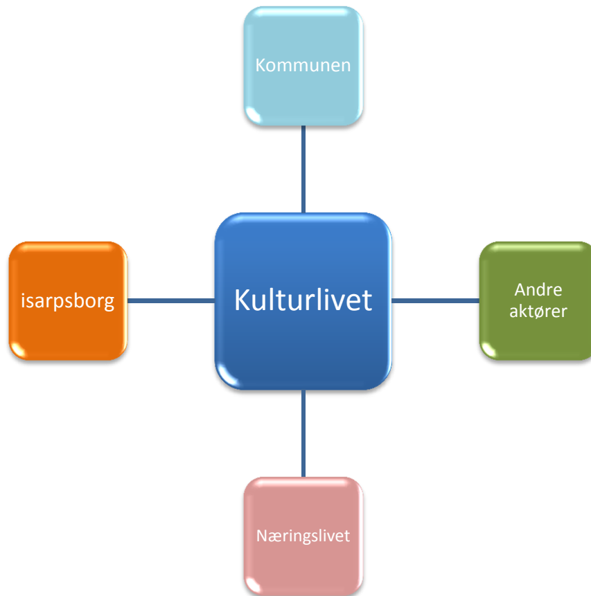
Figur 1: Fempartssamarbeid i Sarpsborg

Det offentlige kan ikke ene og alene finansiere kulturlivet, men kan langt på vei legge til rette for at byen skal få et aktivt og yrende kulturliv. Med byselskapet isarpsborg som bindeledd mellom kommune, kulturaktører, bedrifter og andre eksterne aktører, får man mulighet til å jobbe helhetlig med å utvikle byens kulturliv, blant annet ved at kulturgründere- og aktører kan få nye markedsføringskanaler og bistand til å knytte sponsorkontrakter med næringslivet. Et aktivt kulturliv og kreative gründere er fordelaktig for Sarpsborg som kommune, men også for Sarpsborgs næringsliv. Ved å dra nytte av hverandres kompetanse vil man kunne få et bærekraftig samspill mellom kulturliv og næringsliv.