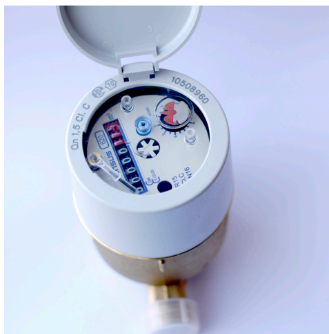
Ny type vannmåler

Årlig avlesning av vannmåler skal gjøres innen 21. desember hvert år. Husstander med vannmåler mottar måleravlesningskort i god tid i forveien. Vannmålere leses av i hele kubikkmeter (dvs. for hver 1000 liter = m 3 ).