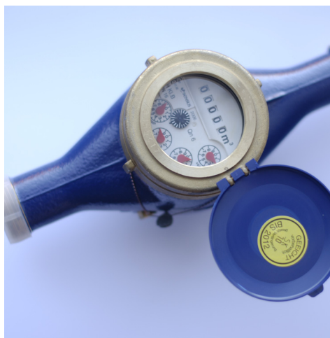
Eldre type vannmåler