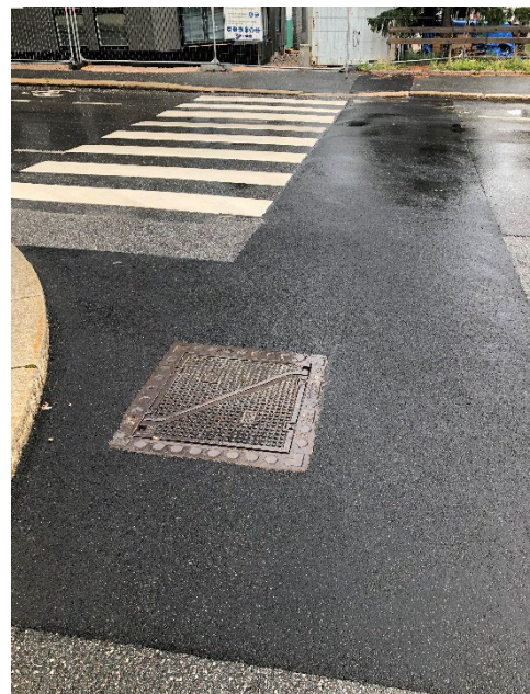
FIGUR 1: HER ER DET BRUKT FEIL KABELKUM

Kabelkummer tillates normalt ikke plassert i kommunale asfalterte kjøreveier. Dersom det unntaksvis gis dispensasjon skal det benyttes kummer med runde, kjøresterke lokk og med fast bunn.