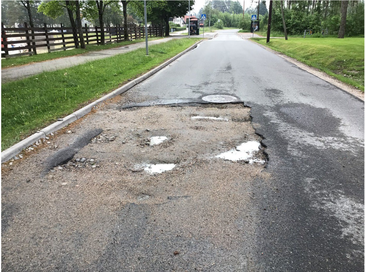
FIGUR 3: MANGELFULL VEDLIKEHOLD ETTER GRAVING

Midlertidig istandsetting: Entreprenøren er ansvarlig for alt vedlikehold på gravstedet frem til veiholder har kontrollert og godkjent arbeidet.