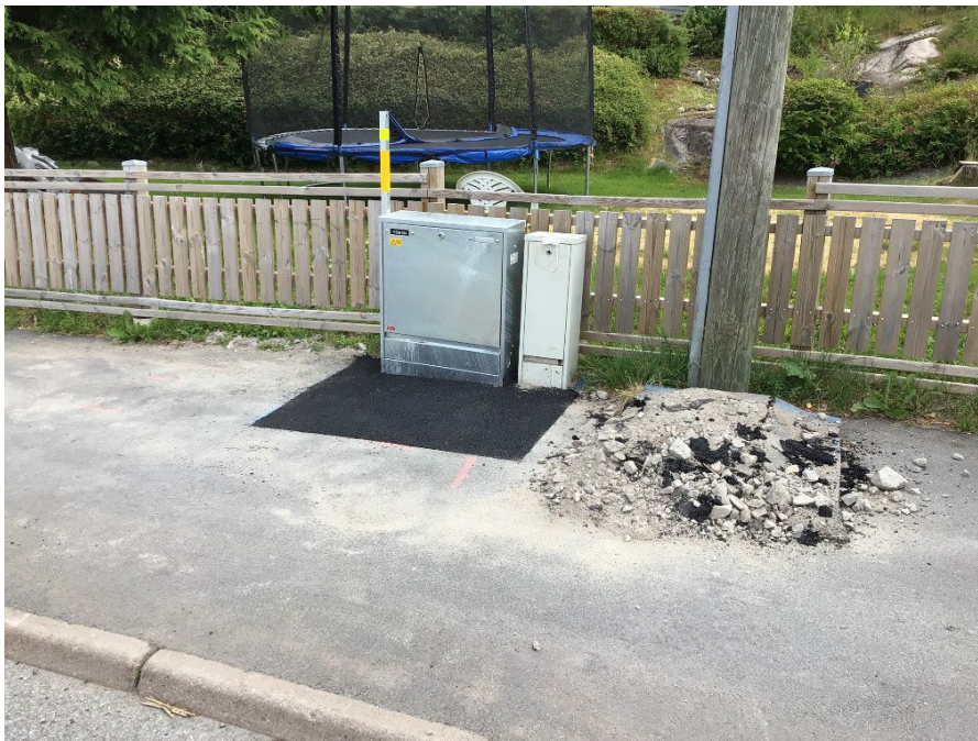
FIGUR 2: FEIL ASFALTERING OG I TILLEGG MANGLENDE FJERNING AV MASSER

Når det graves i fortau og/eller i gang- og sykkelvei skal hele bredden asfalteres.