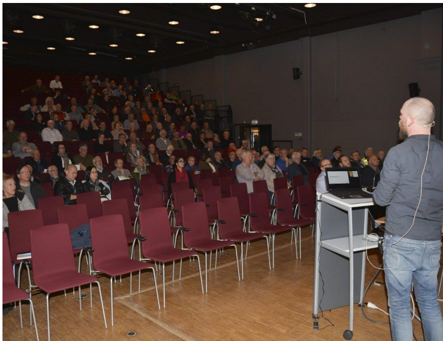
Åpne informasjonsmøter for boligeiere med oljefyrer og nedgravde oljetanker