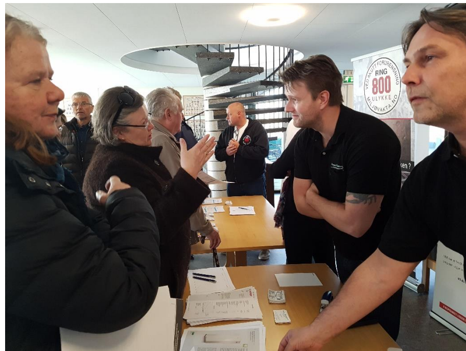
Tilbyder-torg med kvalitetssikrede Energispecialister